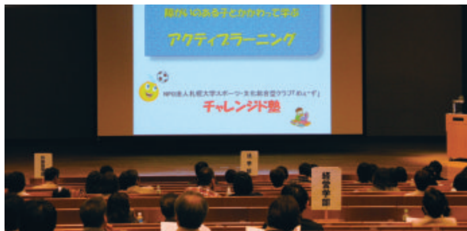
昨年の懇談会の様子(札幌)

保護者懇談会は毎年5月末～6月、9月～10月に全道各地と東北で開かれます。就職をはじめ、さまざまなご質問やご相談にもお応えしています。