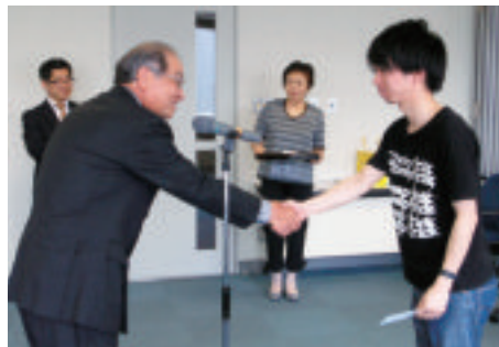
平成25年度 文化系サークル補助金交付式