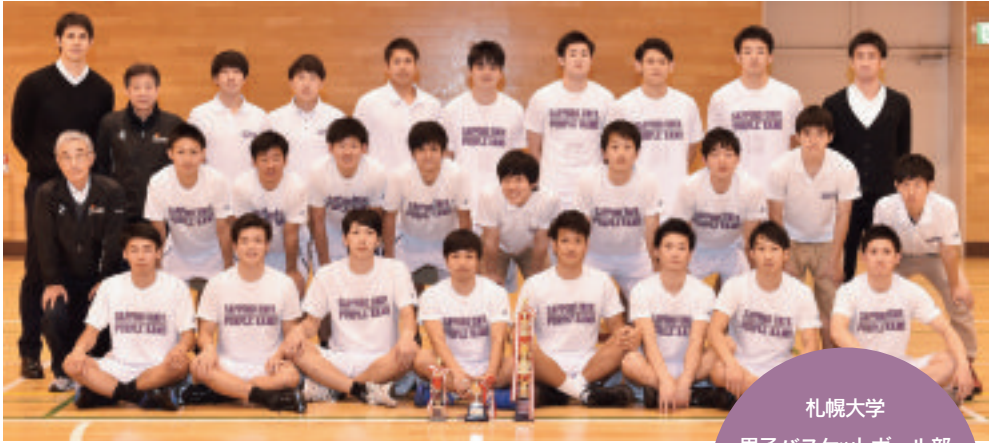
札幌大学 男子バスケットボール部 パープルラムズ (Purple Rams)